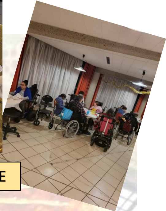
FETES DE FIN D'ANNEE