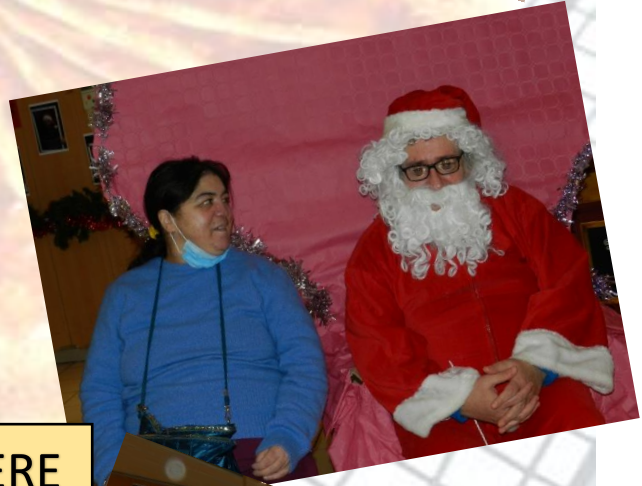
VISITE DU PERE NOËL