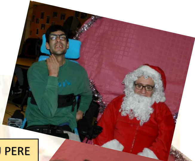
VISITE DU PERE NOËL