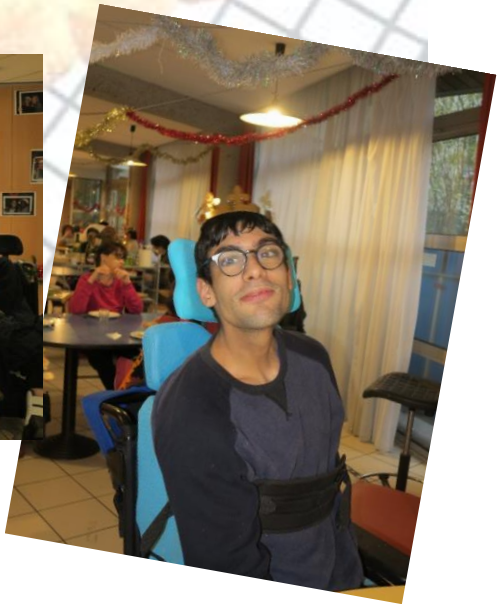
REINES ET ROIS DE L'ÉPIPHANIE