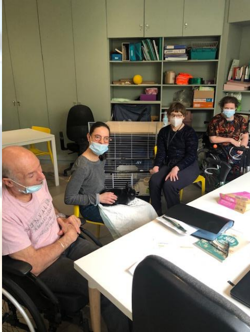
Atelier Revue de presse en compagnie de Tagada